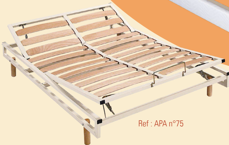
Ref : APA n°75