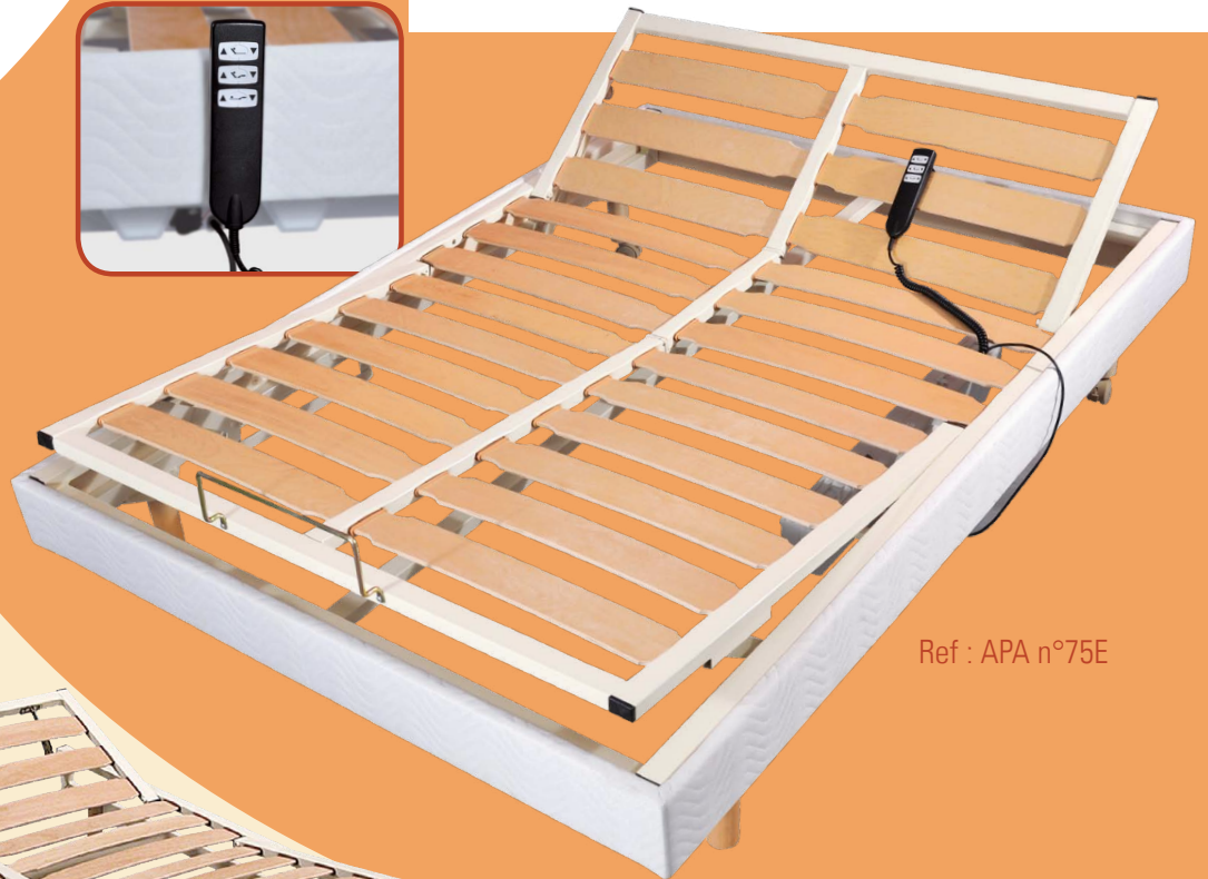
Ref : APA n°75E